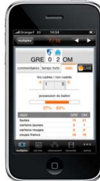
statistiques de match