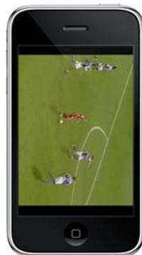
match en direct